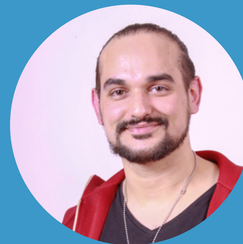
Ion Mikel Landa

“Para los niños cada día es diferente y se aprende algo nuevo”